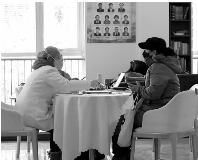
▲居民在临时接种点接种新冠疫苗

年关将至,国内新冠肺炎疫情仍在反复,病例传播情况时有发生,为巩固疫情防控成果,12月30日,黄木厂社区在恒润商务中心西侧底商捌拍未来开设了疫苗临时接种点,提供疫苗第一、二、三针的接种服务,接种者仅需携带身份证和手机即可到现场接种。