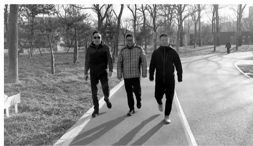
居民在龙潭湖公园开展健步走

“各位叔叔阿姨,冬奥即将来临,大家要提高身体素质,更好的为冬奥提供支援服务。”近日,和平村一社区开展了健步走、普通话推广等系列活动,助力北京冬奥。