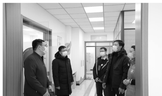
温馨家园工作人员介绍相关情况